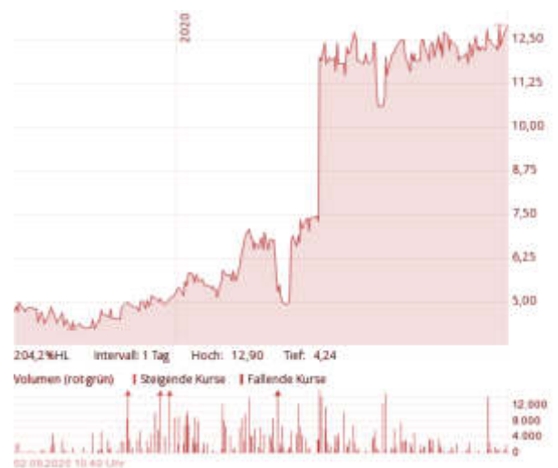
1-Jahres-Chart sino AG, Börse Frankfurt, 02. Sep. 2020

Der Aktienmarkt honorierte diesen Deal prompt: Einen Kurssprung von 7,20 € auf 11,50 € im Rahmen der Meldung. In den vergangenen 6 Monaten hat sich der Aktienkurs nahezu verdoppelt. Die Aktie befindet sich aktuell auf einem Allzeit-Hoch mit knapp 13 €.