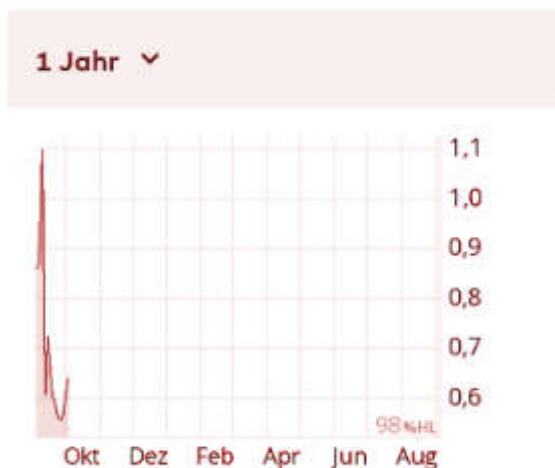
Aktienkurs iSignthis, Jahreschart, ASX