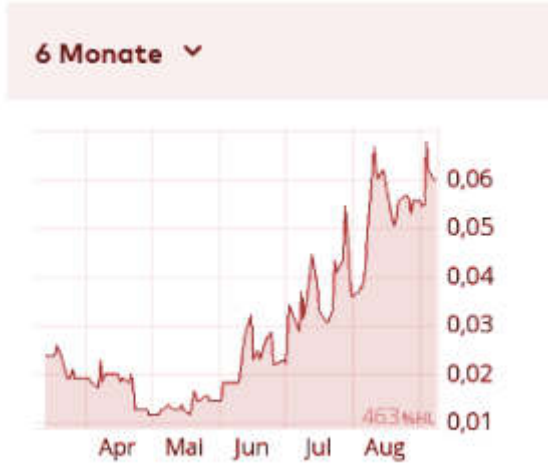
Aktienkursentwicklung Cipherpoint