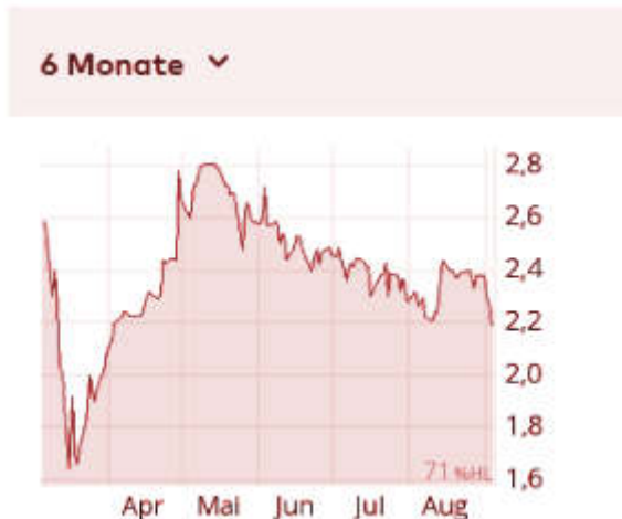
Aktienkursentwicklung mVISE